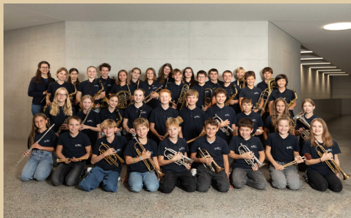
Ventissimo Oberer Sempachersee